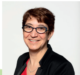
Valérie Corre Ancienne députée du Loiret